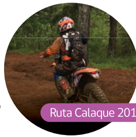
Ruta Calaque 2016