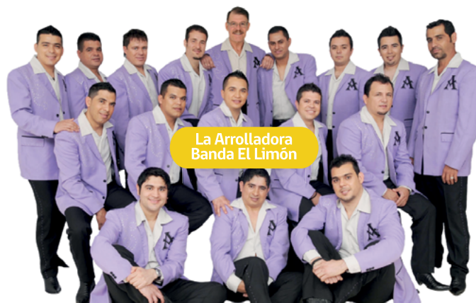
La Arrolladora Banda El Limón

— Boletos: $230 los primeros 2 mil boletos $250 preventa normal Taquilla +$250