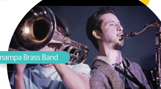
Tenampa Brass Band