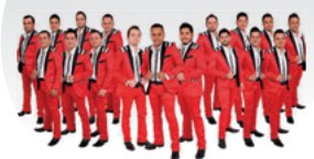
Banda La Adictiva