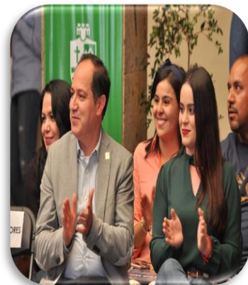
EN PATIO CENTRAL DE PRESIDENCIA MUNICIPAL