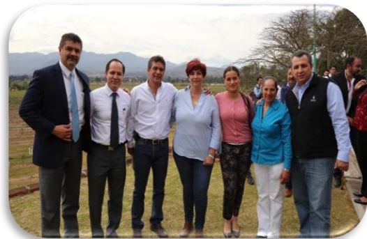
PATIO CENTRAL DE LA PRESIDENCIA MUNICIPAL 27/02/2019