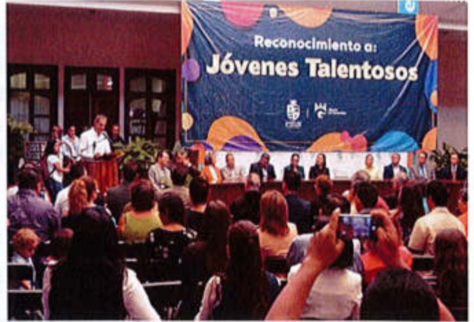
20 DE JUNIO 2019- XI ENTREGA DE RECONOCIMIENTOS A "JOVENES TALENTOSOS 2019"