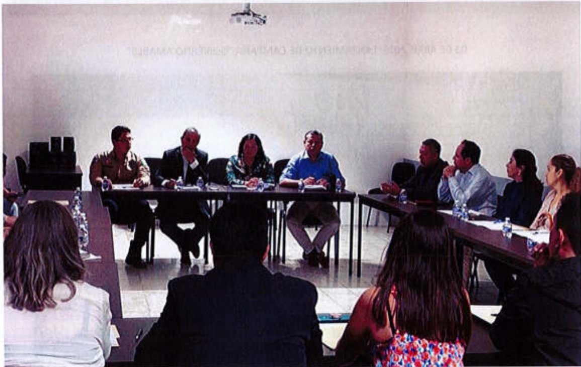
18 DE MARZO- PRESENTACIÓN DEL PLAN MUNICIPAL DE SEGURIDAD PUBLICA

Av. Cristobal Colón #62, Centro Histórico CP 49000, Cd. Guzmán, Zapotlán el Grande, Jal. Tel: (341) 575 2500 www.ciudadguzman.gob.mx