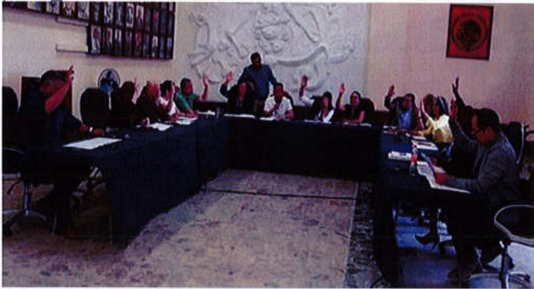
05 DE ABRIL 2019- SESION EXTRAORDINARIA NO.15