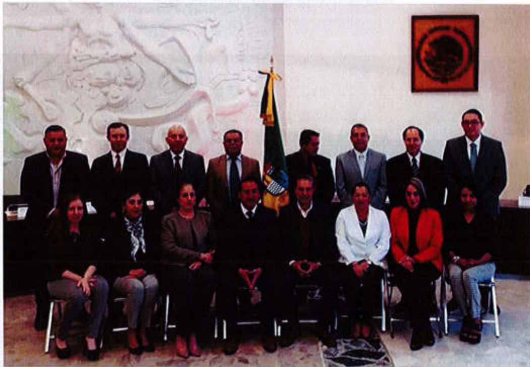
29 DE ABRIL 2019- SESION EXTRAORDINARIA NO. 16