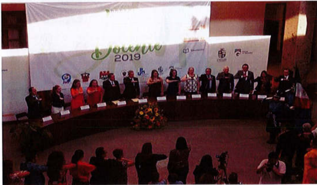
24 DE MAYO 2019- SESIÓN SOLEMNE NO. 04