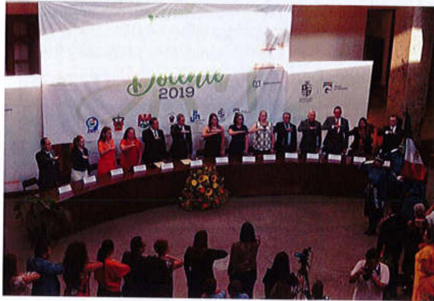
24 DE MAYO 2019- PRESEA EL MERITO DOCENTE 2019.