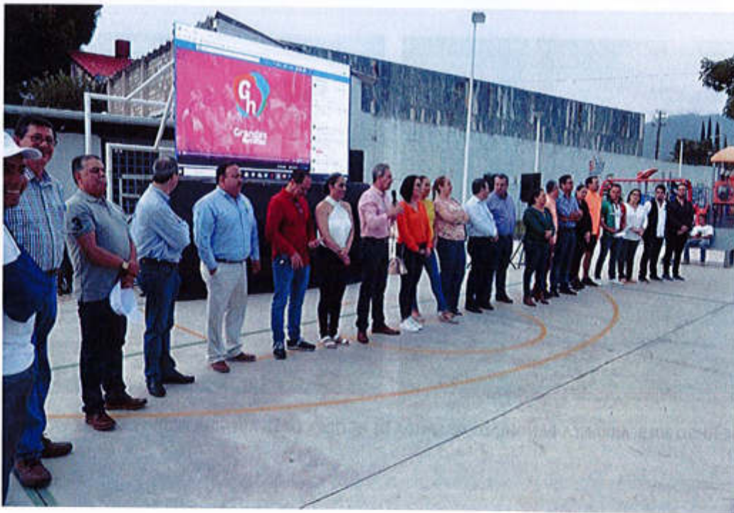
14 DE JUNIO 2019- INAGURACION INTERNET GRATUITO EN EL PARQUE SANTA ROSA.