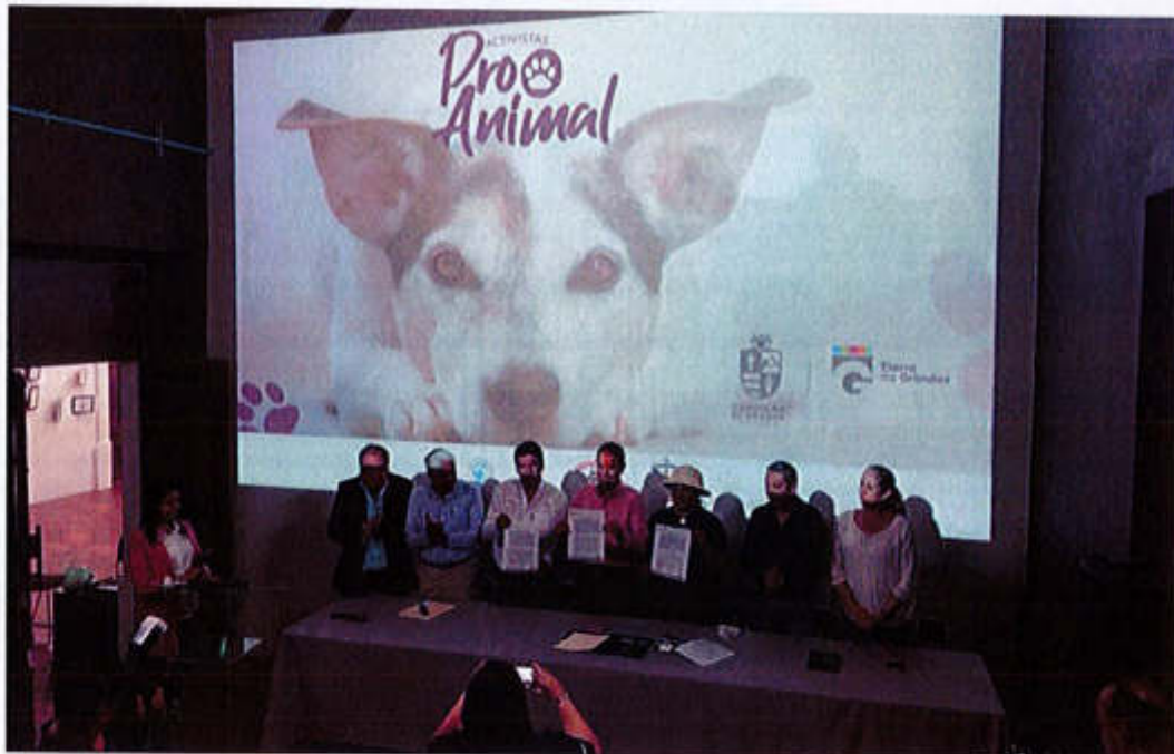
09 DE ABRIL 2019- PRESENTACION DE LA POLITICA PÚBLICA PRO- ANIMAL Y LA FIRMA DEL CONVENIO CON LA ASOCIACIÓN PROTECTORA DE ANIMALES "ECHANOS LA PATA A.C"

Av. Cristobal Colón #62, Centro Histórico CP 49000, Cd. Guzmán, Zapotlán el Grande, Jal. Tel: (341) 575 2500 www.ciudadguzman.gob.mx