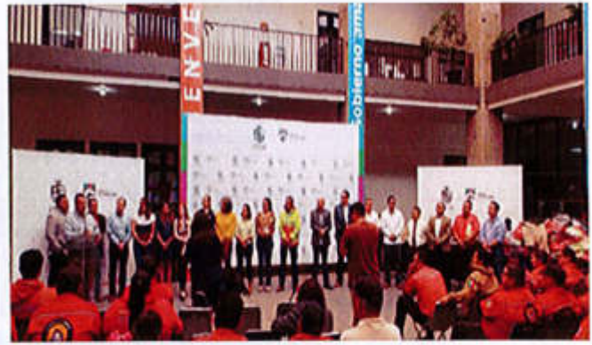
17 DE MAYO 2019- ENTREGA DE UNIFORMES A LOS ELEMENTOS DE UNIDAD MUNICIPAL DE PROTECCIÓN CIVIL Y BOMBEROS DE ZAPOTLAN EL GRANDE.