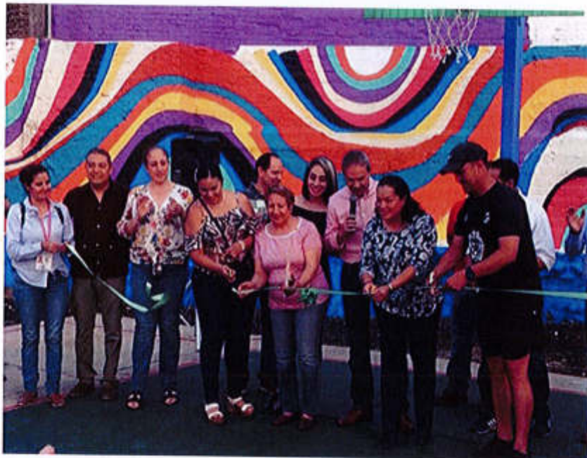
28 DE MAYO 2019- PARQUE "LOS OLIVOS" UN ESPACIO MAS PARA LA FAMILIA, LOS NIÑOS, LA JUVENTUD NAUGURADO CON PADRINO DE LUJO, MANUEL VIDRIO EX SELECCIONADO NACIONAL Y CAPITAN DE NUESTRA SELECCIÓN "ZAPOTLAN EL GRANDE" EN EL TORNEO COPA JALISCO.