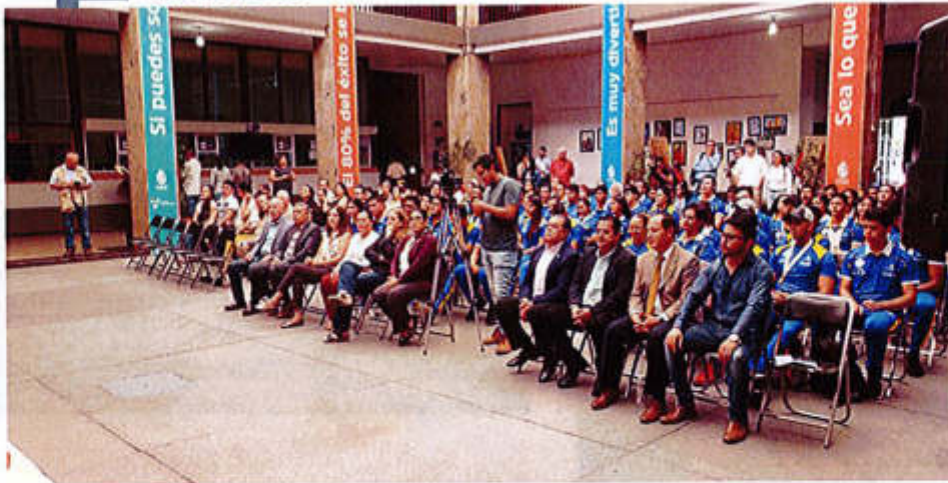
27 DE JUNIO 2019- RECONOCIMIENTO A ATLETAS DE LA OLIMPIADA NACIONAL.

ATENTAMENTE CIUDAD GUZMÁN, MUNICIPIO DE ZAPOTLÁN EL GRANDE, JALISCO, JUNIO 31 DE 2019.