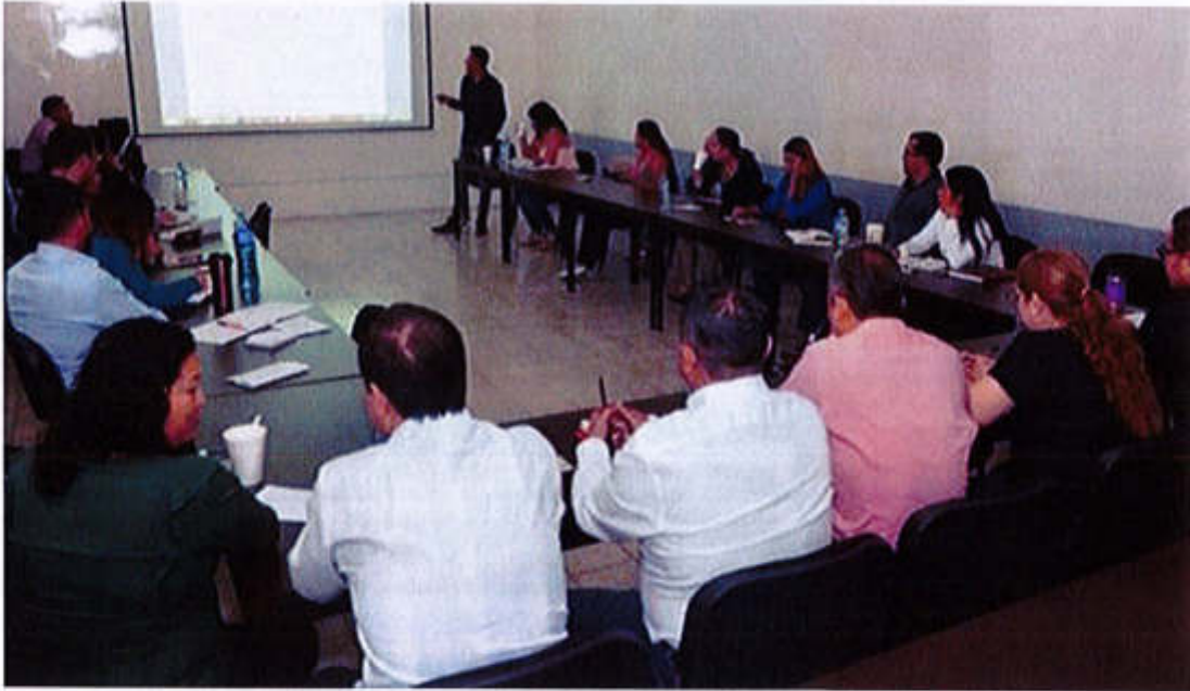
25 DE ABRIL 2019- PERSONAL DE CONTRALORÍA DEL GOBIERNO DE ZAPOTLÁN EL GRANDE REALIZÓ UNA CAPACITACIÓN EN LA SALA "ALBERTO ESQUER GUTIÉRREZ", PARA QUE LOS SERVIDORES PÚBLICOS PUEDAN REALIZAR A TIEMPO SU DECLARACIÓN PATRIMONIAL.