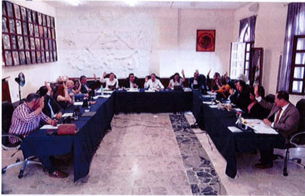
27 DE JUNIO 2019- SESIÓN ORDINARIA NO. 07