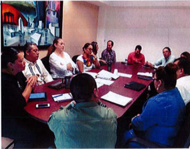
29 DE MAYO 2019- SESIÓN ORDINARIA NO 08.