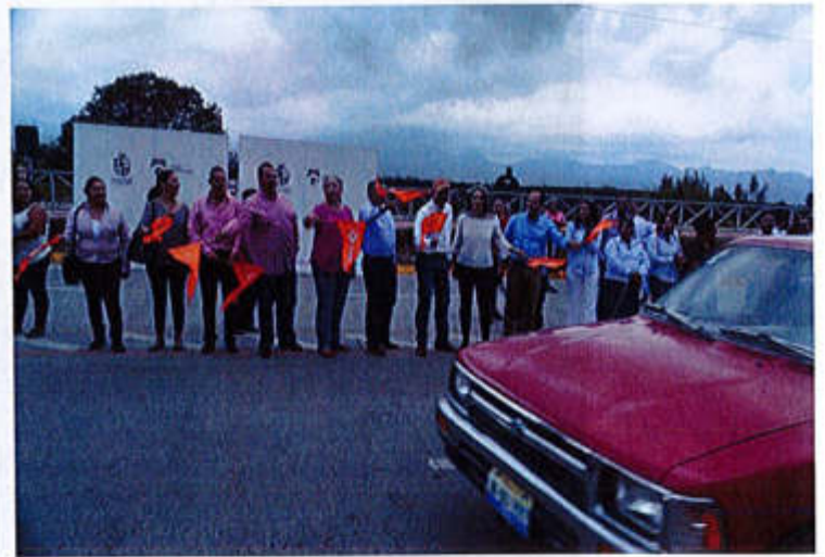
18 DE JUNIO 2019- ARRANCA BANDERAZO DE SALIDA DE LA OBRA DE LA AVENIDA PEDRO RAMIREZ VÁZQUEZ.

Av. Cristobal Colón #62, Centro Histórico CP 49000, Cd. Guzmán, Zapotlán el Grande, Jal. Tel: (341) 575 2500 www.ciudadguzman.gob.mx