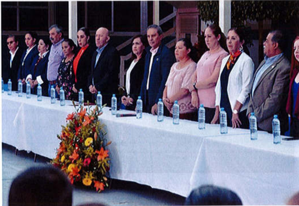
08 DE MAYO 2019- INVITACIÓN A FORMAR PARTE DEL PRESIDIO EN LA CEREMONIA CIVICA DEL 266 "ANIVERSARIO DE LA BATALLA DE PUEBLA (1852) EN LA ESCUELA SECUNDARIA ALFREDO VELASCO CISNEROS.