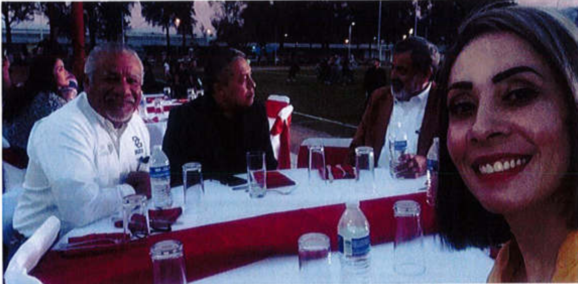
27 DE MARZO 2019. INAUGURACIÓN DE LOS JUEGOS AGROMAR 2019 ESTADIO OLÍMPICO.