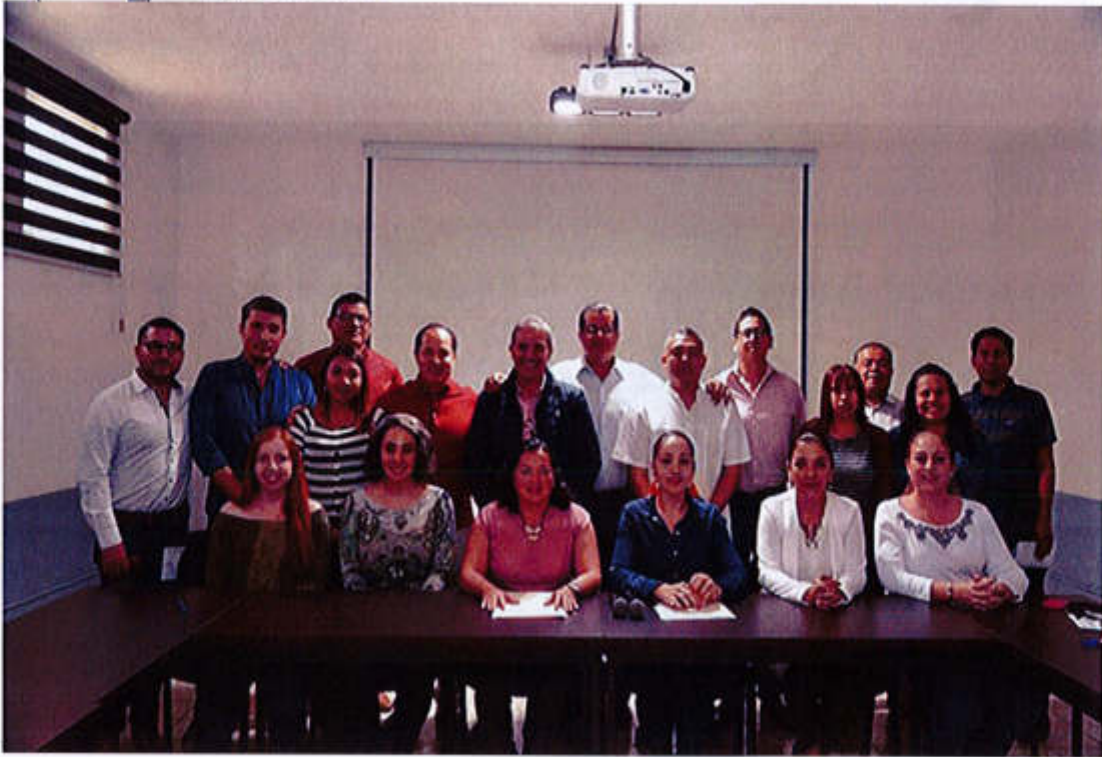
25 DE ABRIL 2019- INVITACION AL EVENTO DE LA INTEGRACIÓN DE LA JUNTA DE GOBIERNO DEL INSTITUTO MUNICIPAL DE LA MUJER EN ZAPOTLAN EL GRANDE.