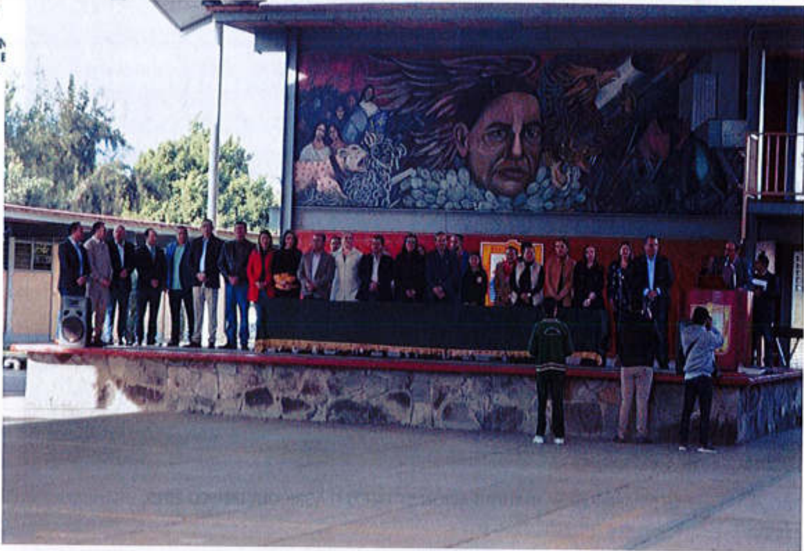
03 DE ABRIL 2019- LANZAMIENTO DE CAMPAÑA "GOBIERNO AMABLE"