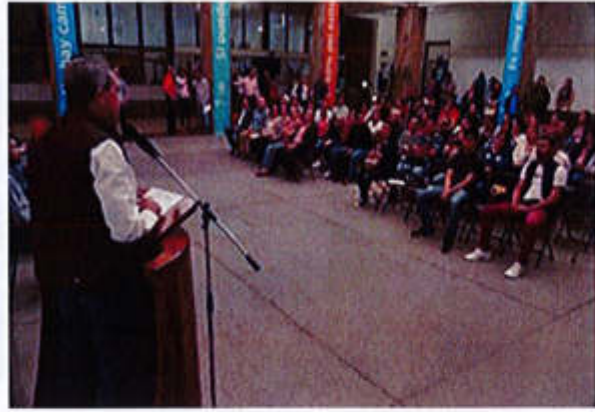
18 DE JUNIO 2019- ACTO PROTOCOLARIO DEL PROGRAMA DE EMPLEO TEMPORAL.