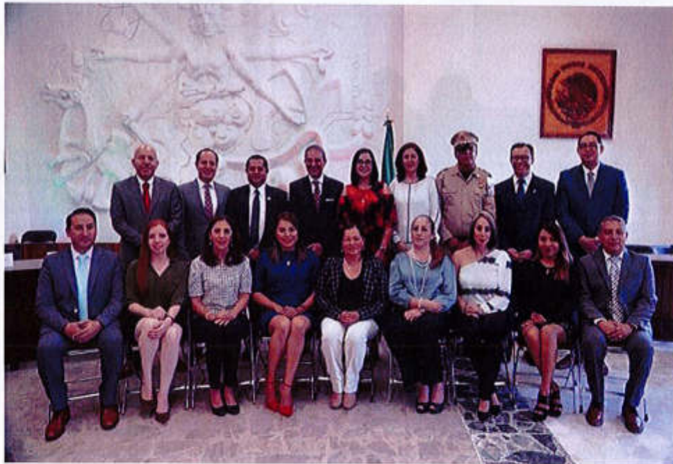
29 DE JUNIO 2019- SESION SOLEMNE NO. 05