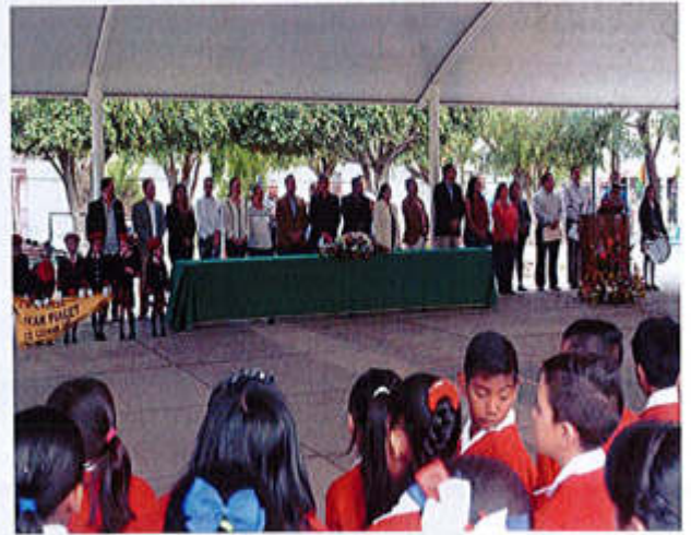
17 DE JUNIO 2019- INVITACION A FORMAR PARTE DEL PRESIDIO EN LA CEREMONIA CIVICA DEL 196 AVIERSARIO DE LA CREACIÓN DEL ESTADO LIBRE Y SOBERANO DE JALISCO (1823) EN LA ESCUELA PRIMARIA "CRISTOBAL COLON"