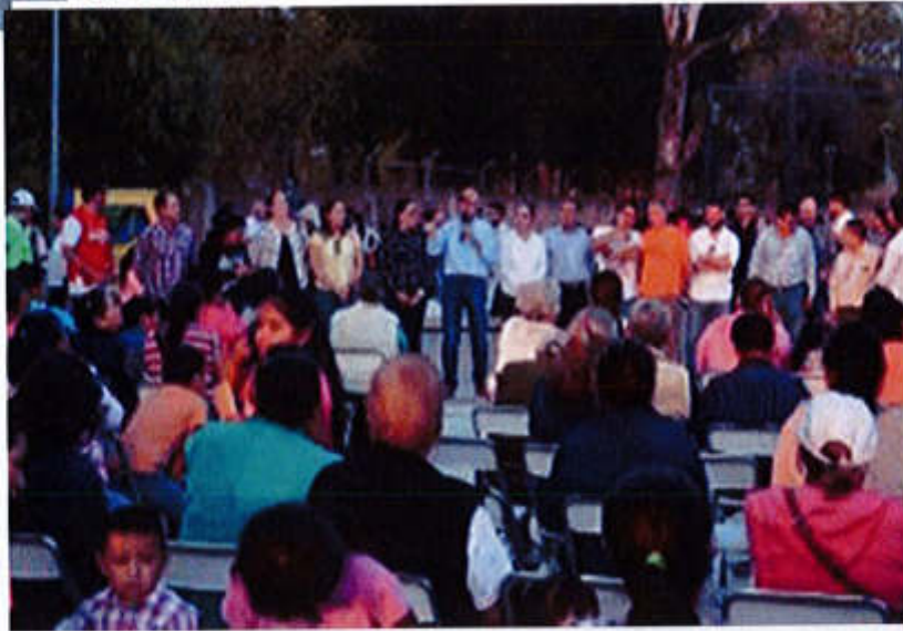
01 DE JUNIO 2019- INAGURACION DEL PARQUE COLOMBO.