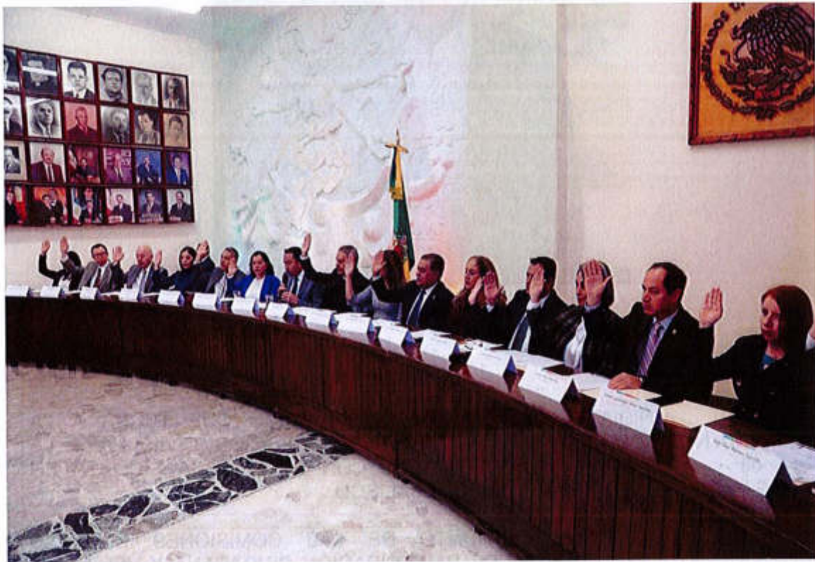
02 DE ABRIL 2019- SESIÓN EXTRAORDINARIA NO. 14