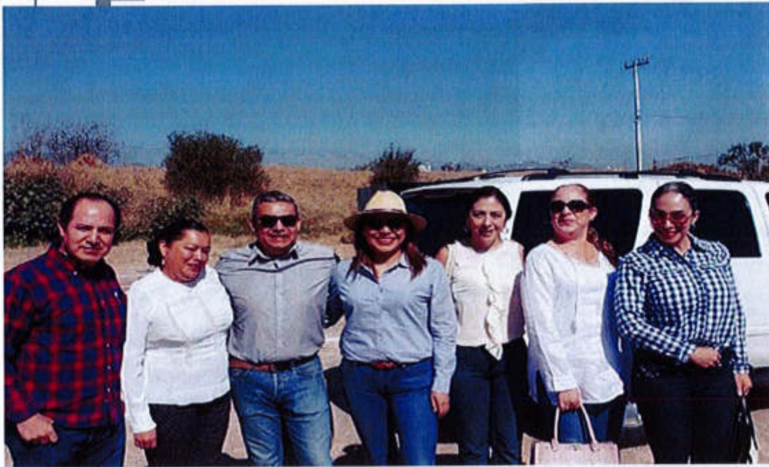
10 DE ABRIL 2019- INAUGURACION DE LA EXPO AGRICOLA JALISCO 2019.