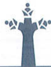
03 DE JUNIO 2019- CONVENIO DE COLABORACION QUE REALIZA EL MUNICIPIO DE ZAPOTLAN EL GRANDE Y LA COMISION NACIONAL Y ESTATAL DE DERECHOS HUMANOS.