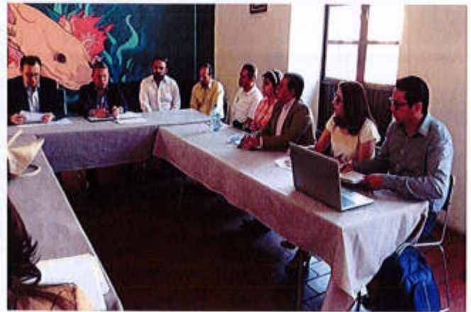
25 DE ABRIL 2019. SESIÓN ORDINARIA NO. 05