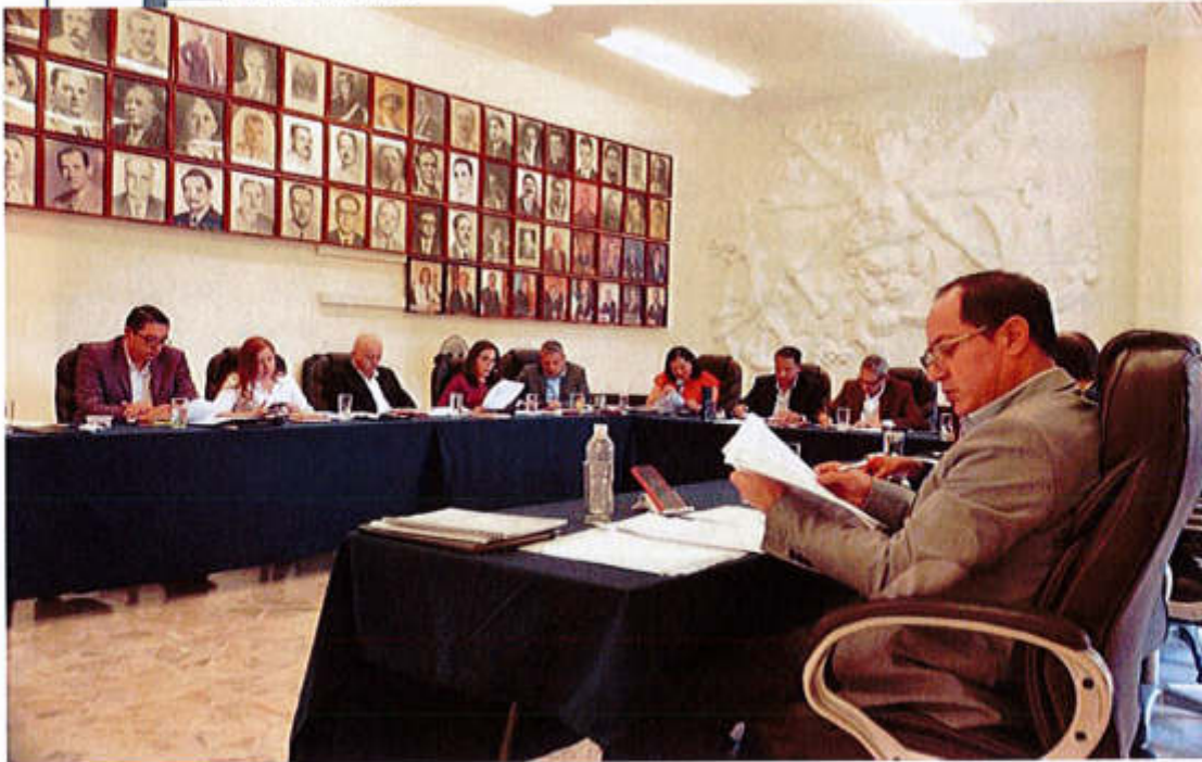
14 DE MAYO 2019- SESIÓN ORDINARIA NO. 6