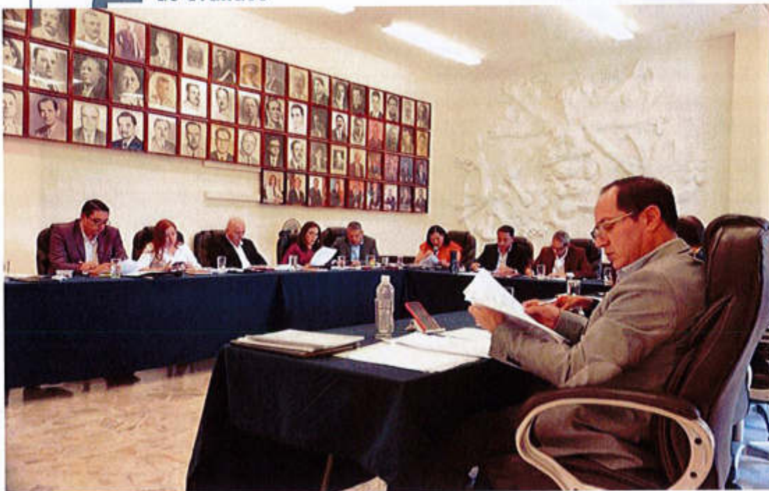
14 DE MAYO 2019- SESIÓN ORDINARIA NO. 6