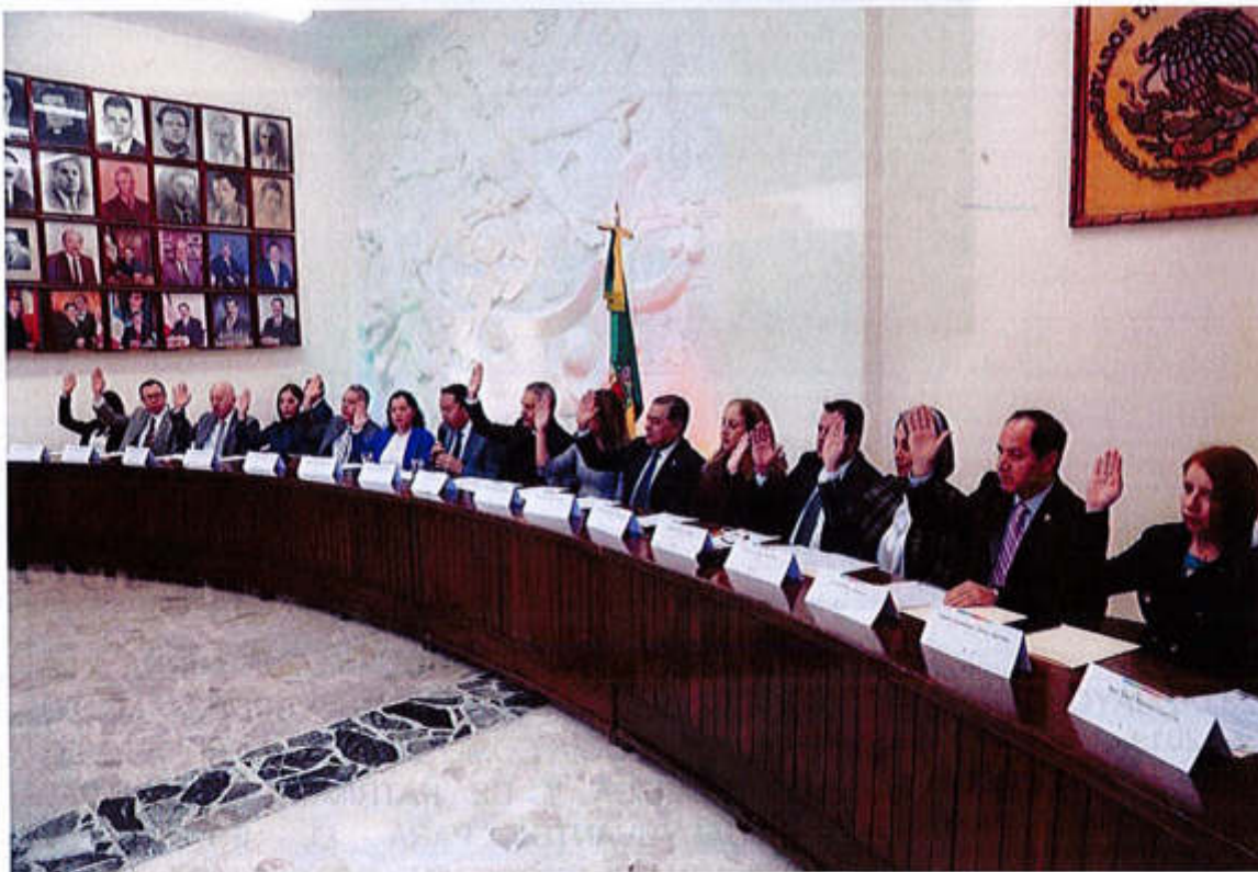
02 DE ABRIL 2019- SESIÓN EXTRAORDINARIA NO. 14