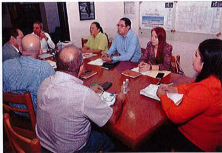
21 DE JUNIO 2019.