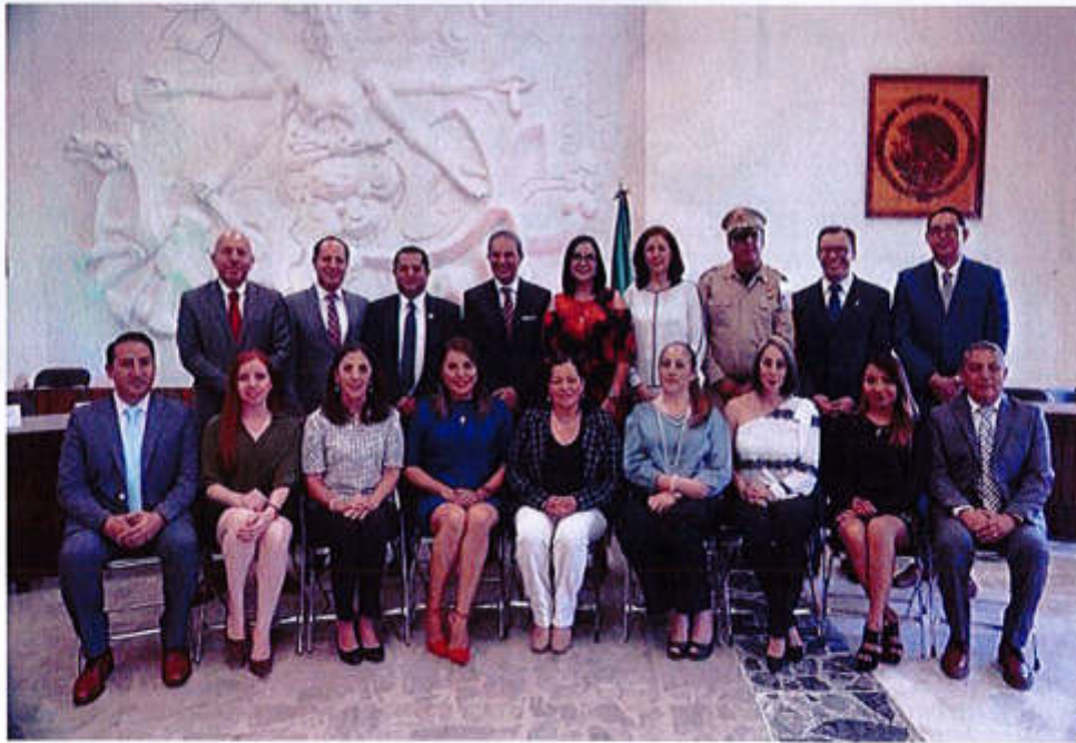
29 DE JUNIO 2019- SESION SOLEMNE NO. 05