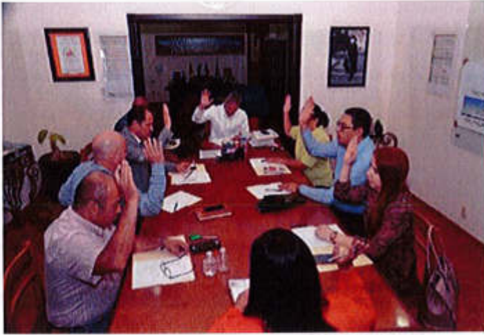
2019 JUN 19 10:00 AM