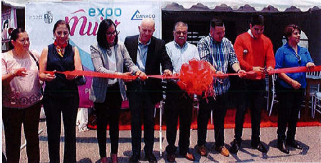
09 DE MAYO 2019.