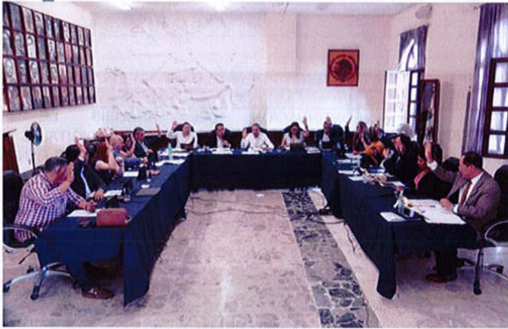
27 DE JUNIO 2019- SESIÓN ORDINARIA NO. 07