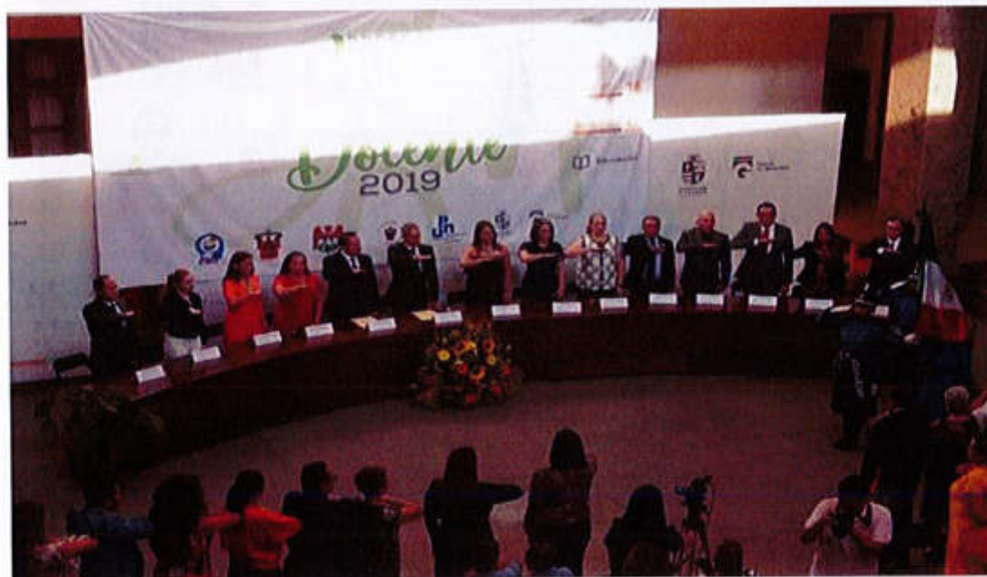
24 DE MAYO 2019- SESIÓN SOLEMNE NO. 04