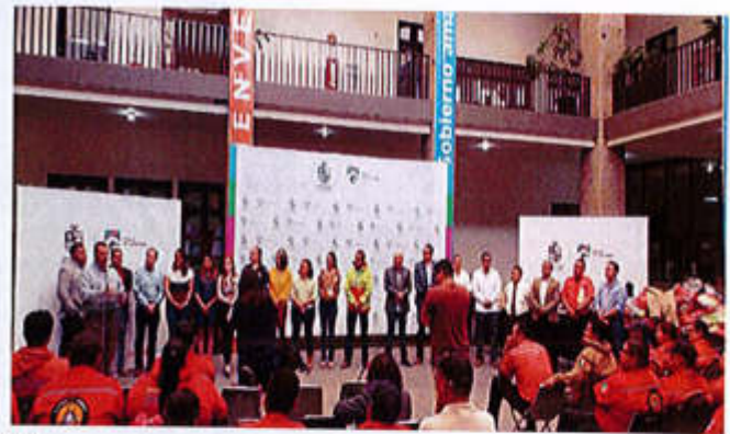
29 DE MAYO 2019.