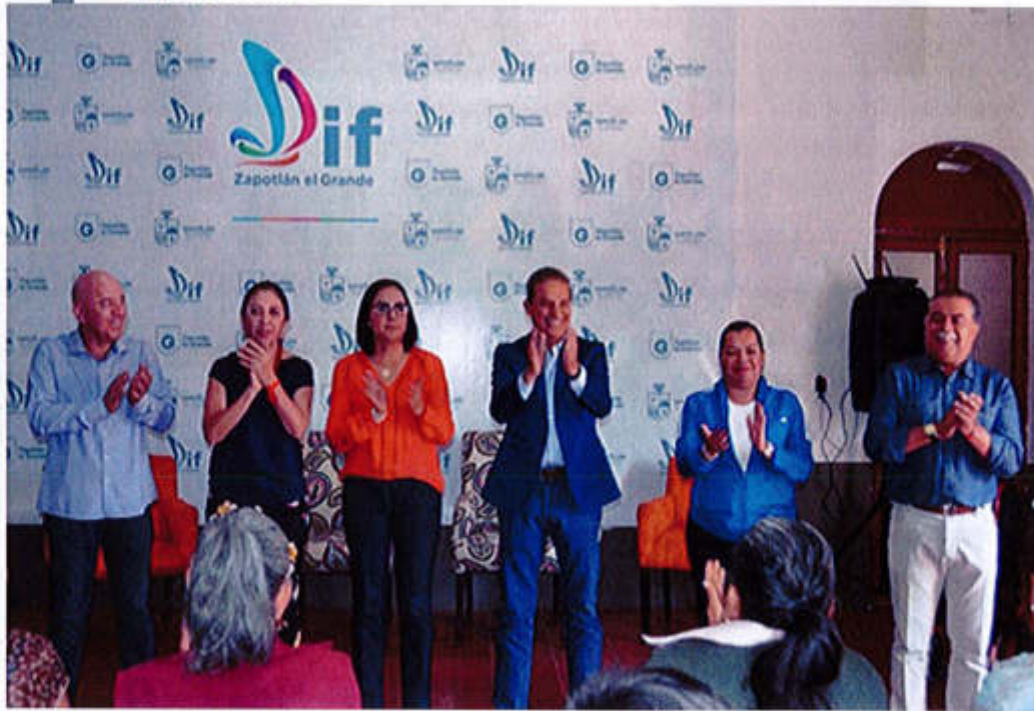
22 DE JUNIO 2019.