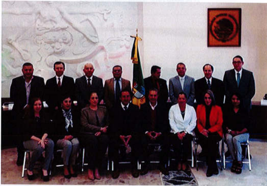
29 DE ABRIL 2019- SESION EXTRAORDINARIA NO. 16