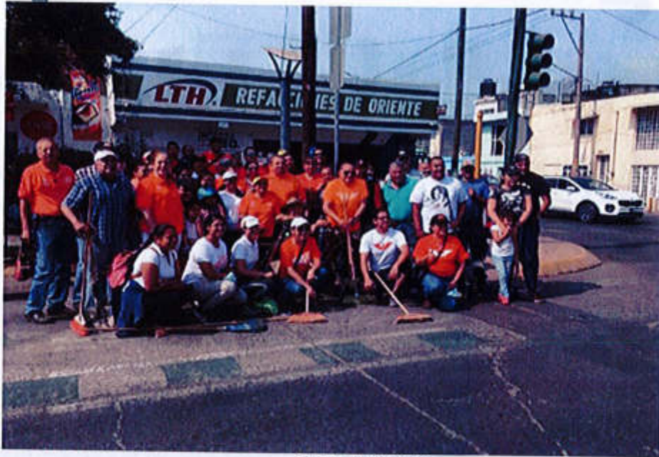
25 DE MAYO 2019.