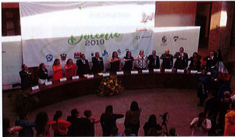
24 DE MAYO 2019.