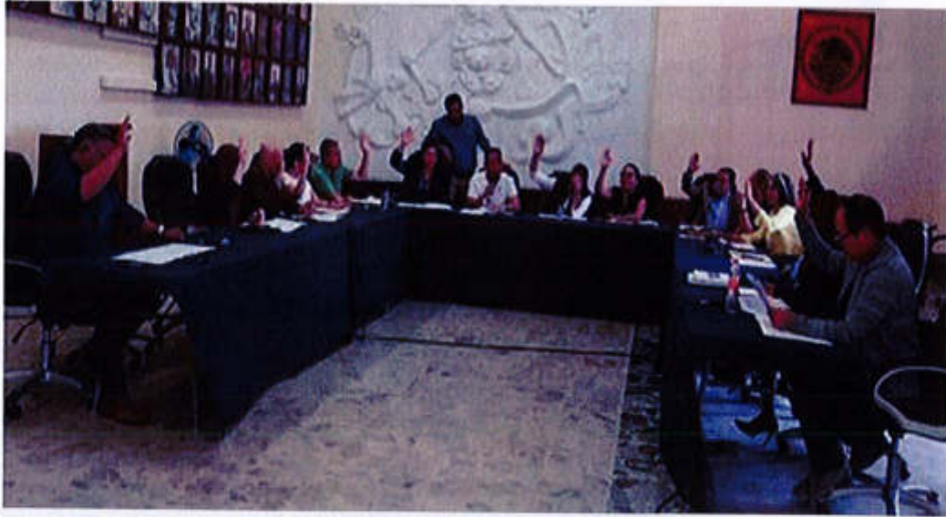
05 DE ABRIL 2019- SESION EXTRAORDINARIA NO.15