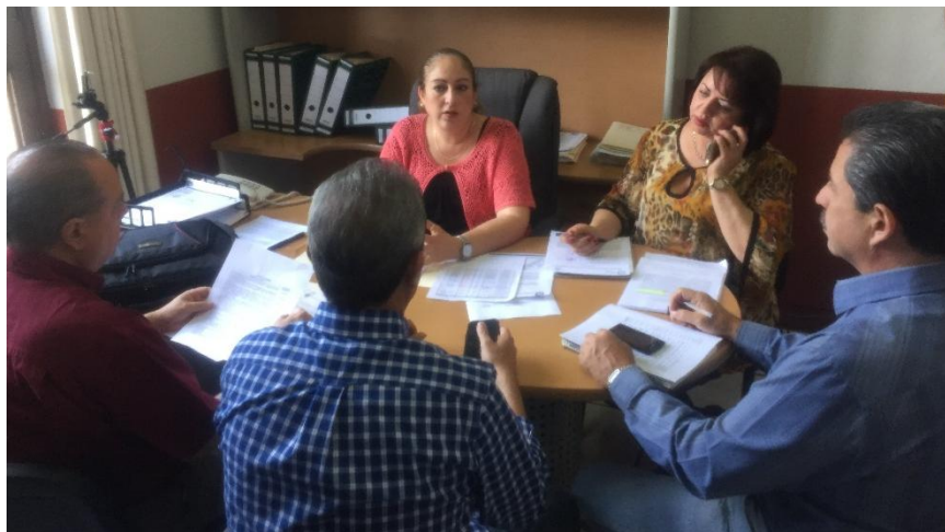
SESION EXTRAORDINARIA. 27 DE ABRIL DE 2017.