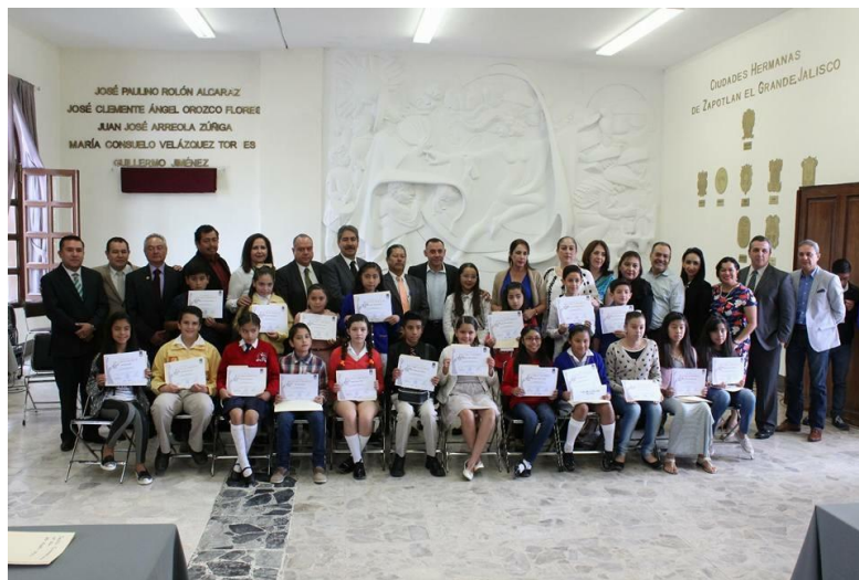
SESIÓN EXTRAORDINARIA NO.32 28 DE ABRIL DE 2017. AYUNTAMIENTO INFANTIL