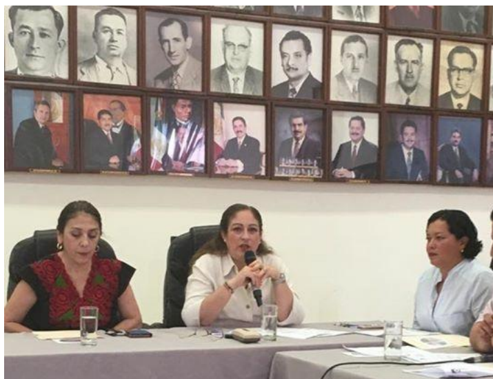
SESIÓN EXTRAORDINARIA NO. 38