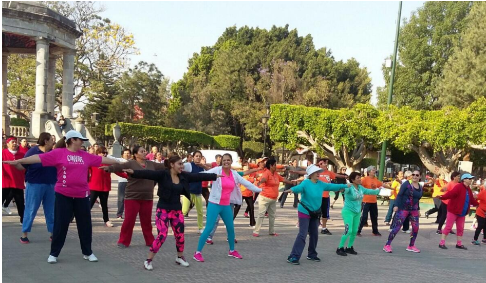
DIA MUNDIAL DE LA ACTIVACION FISICA. 06 DE ABRIL DE 2017