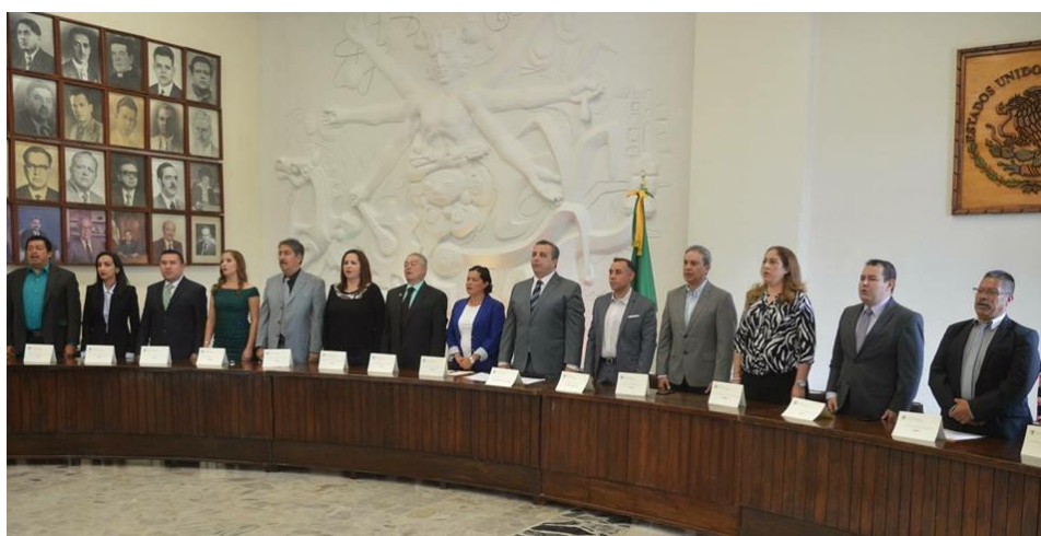
SESION SOLEMNE NO. 10. 29 DE JUNIO DE 2017