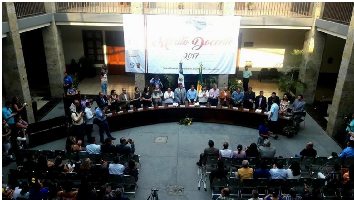
SESION SOLEMNE 09. ENTREGA DE PRESEAS AL MERITO DOCENTE. 12 DE MAYO DE 2017