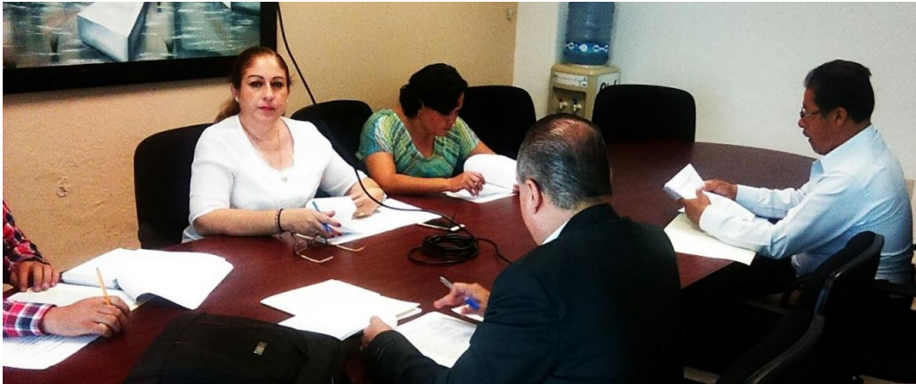
SESION ORDINARIA. 22 DE JUNIO DE 2017