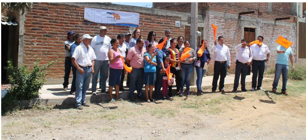
ARRANQUE DE PROGRAMA DE PIES DE CASA. 12 DE ABRIL DE 2017