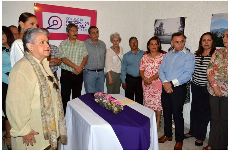
ENTREGA DE SOLICITUD AL CONSEJO DE PARTICIPACION CIUDADANA. 23 DE MAYO DE 2017.