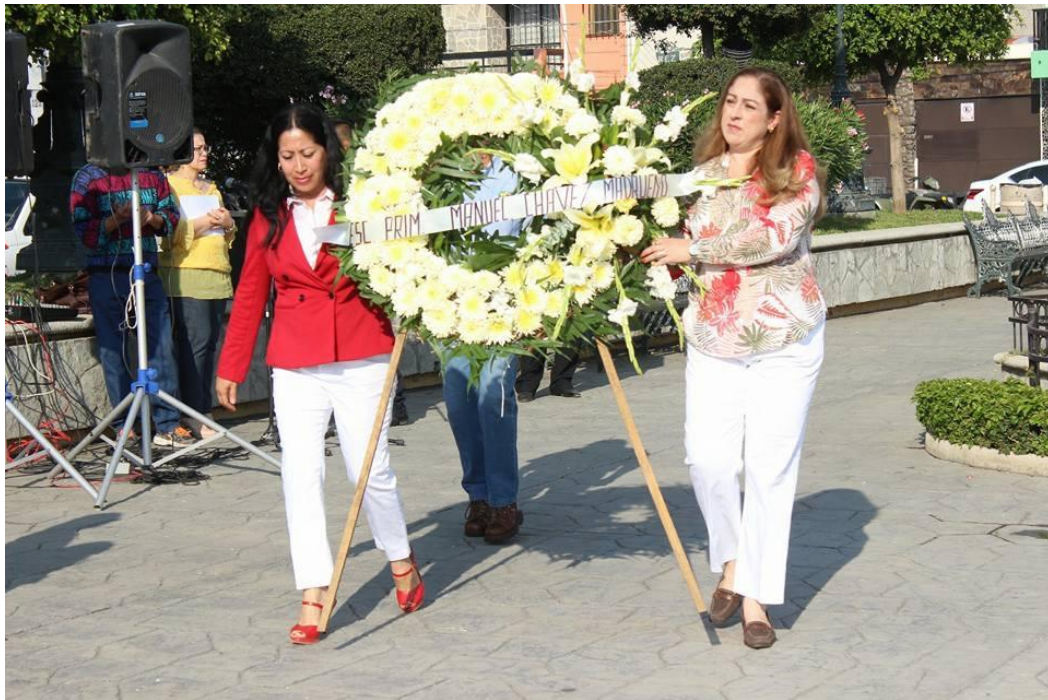
ANIVERSARIO DEL NATALICIO DE MIGUEL HIDALGO. 08 DE MAYO DE 2017