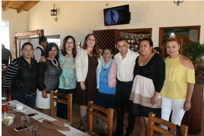
DESAYUNO DE MUJERES DEL GOBIERNO MUNICIPAL. 09 DE MAYO DE 2017