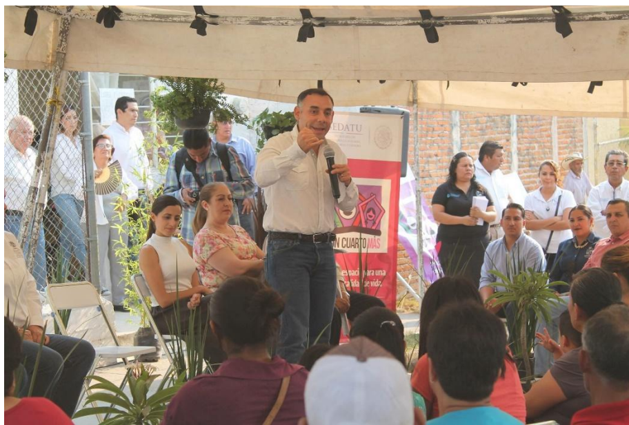
ARRANQUE DE LA SEGUNDA ETAPA DE CUARTO ROSA, EN LA COLONIA SAN JOSE. 22 DE MAYO DE 2017.