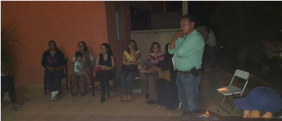
REUNION CON LOS VECINOS DE LA COLONIA INSURGENTES. 20 DE JUNIO DE 2017