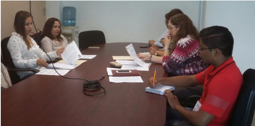
SESION ORDINARIA. 20 DE JUNIO DE 2017