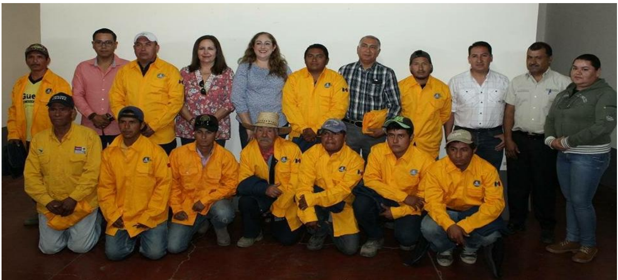
ENTREGA DE UNIFORMES A LA BRIGADA CONTRA INCENDIOS. 12 DE ABRIL DE 2017