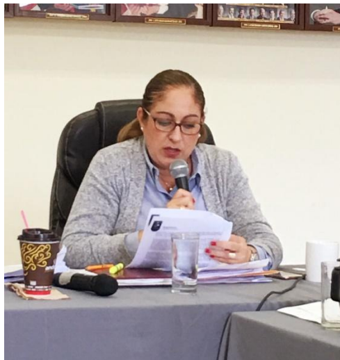
SESION ORDINARIA NO. 17