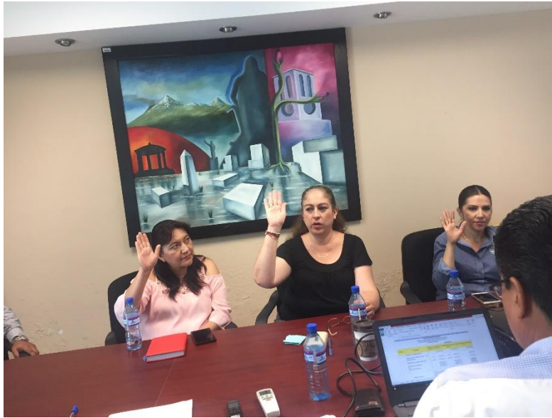
FALLO EN LA COMISION DE ADQUISICIONES 24 DE MAYO DE 2017