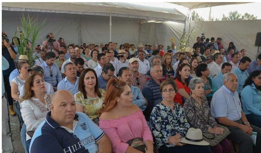
EVENTO INAUGURAL EXPO AGRICOLA JALISCO 2017. 03 DE MAYO DE 2017