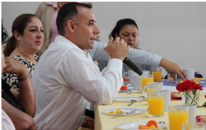
DESAYUNO-DESPEDIDA DE PERSONAL JUBILADO DEL DIF MUNICIPAL. 30 DE MAYO DE 2017