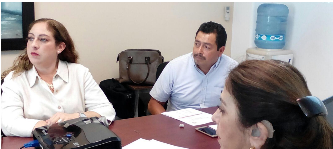
SESION ORDINARIA. 01 DE JUNIO DE 2017