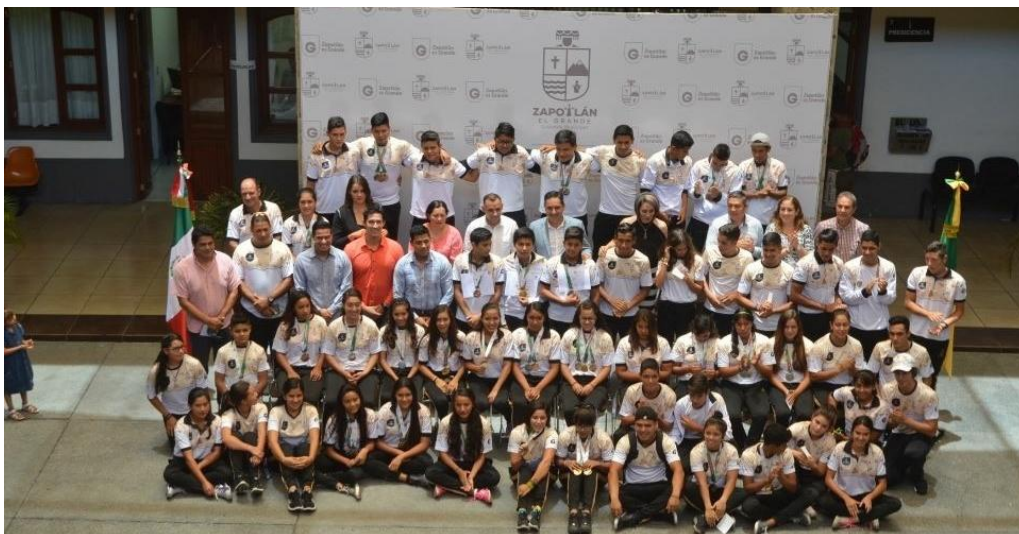
ENTREGA DE RECONOCIMIENTOS AL EQUIPO DE DEPORTISAS ZAPOTLENSES QUE PARTICIPARON EN LA OLIMPIADA NACIONAL REPRESENTANDO A JALISCO. 27 DE JUNIO DE 2017.