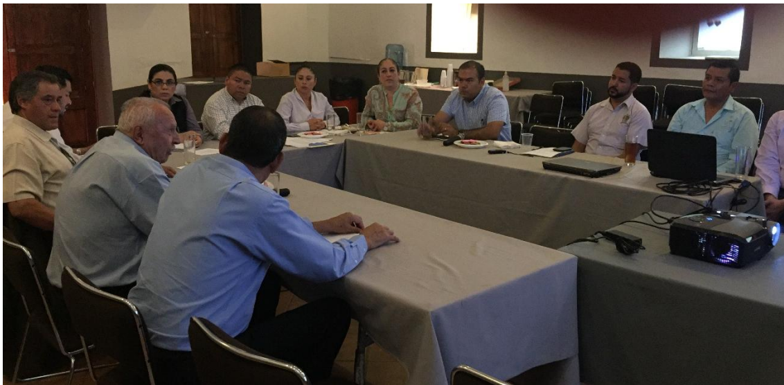
PRIMERA SESION ORDINARIA. 16 DE MAYO DE 2017