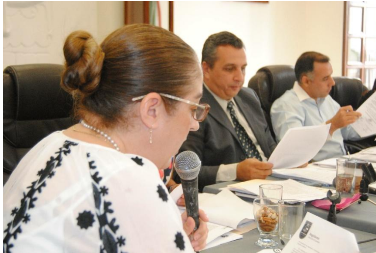
SESION ORDINARIA NO. 15