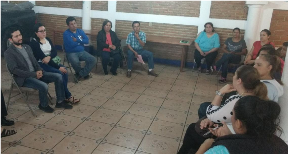
REUNION DE TRABAJO CON LA ASOCIACIÓN VECINAL DE COLONIA LAS AZALEAS. 28 DE ABRIL DE 2017