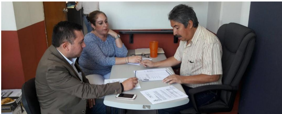
07 DE ABRIL DE 2017