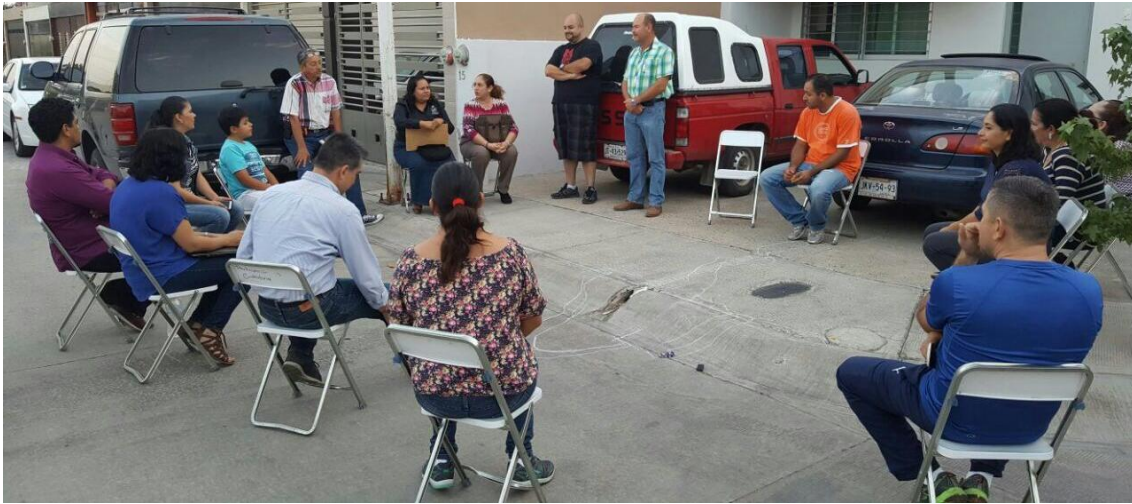
REUNION PARA LA CONFORMACIÓN DE LA ASOCIACION VECINAL DE RINCONADA SANTA NATALIA. 20 DE JUNIO DE 2017