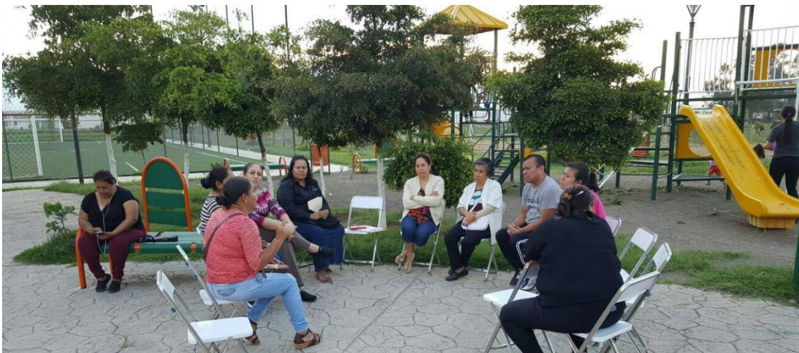
REUNION CON ASOCIACION VECINAL DE LA COLONIA BENEFACTORES Y TEOCALLI DEL MUNICIPIO. 20 DE JUNIO DE 2017.