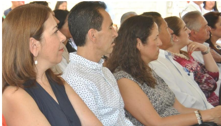
INFORME ANUAL DE UTR, CENTRO DE INTEGRACION JUVENIL.. 18 DE MAYO DE 2017