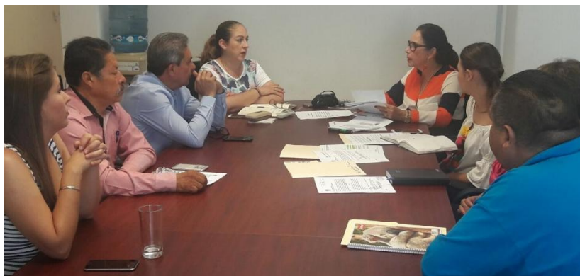
SESION ORDINARIA. 08 DE JUNIO DE 2017