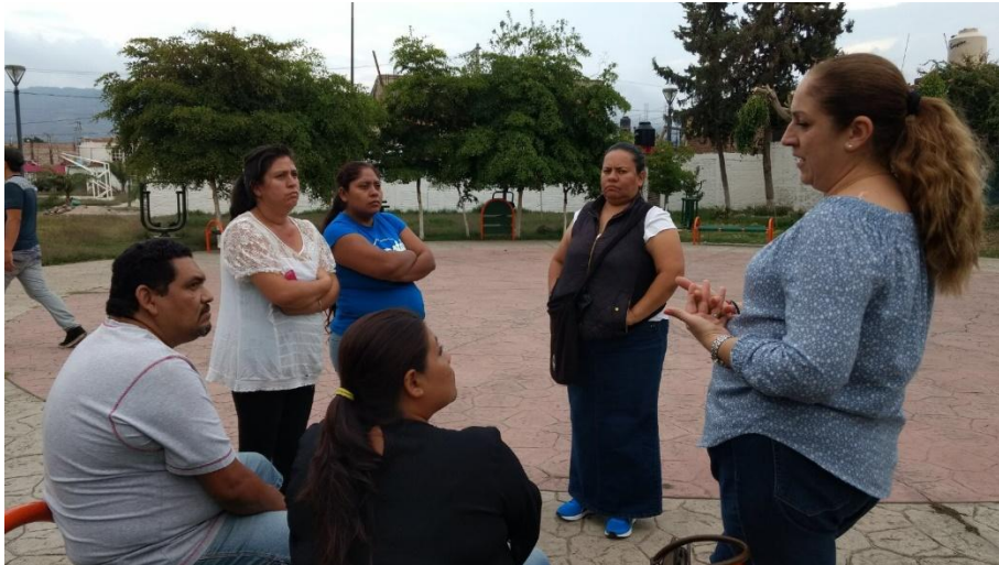
REUNION CON VECINOS COLONIA BENEFACTORES. 12 DE JUNIO