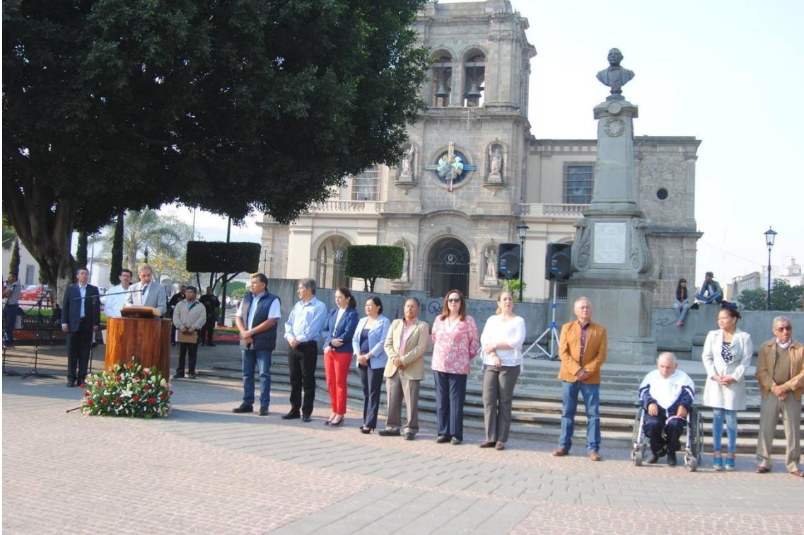
ACTO CONMEMORATIVO DE LA BATALLA DE PUEBLA. 05 DE MAYO DE 2017