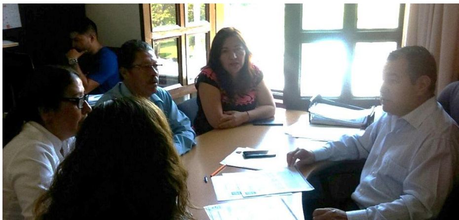
SESION EXTRAORDINARIA. 23 DE JUNIO DE 2017