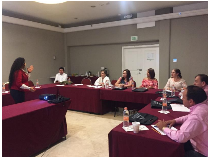
PARTICIPACION EN EL TALLER DE MANEJO Y SOLUCION DE CONFLICTOS SOCIALES. 15 Y 16 DE JUNIO DE 2017, GUADALAJARA, JALISCO.