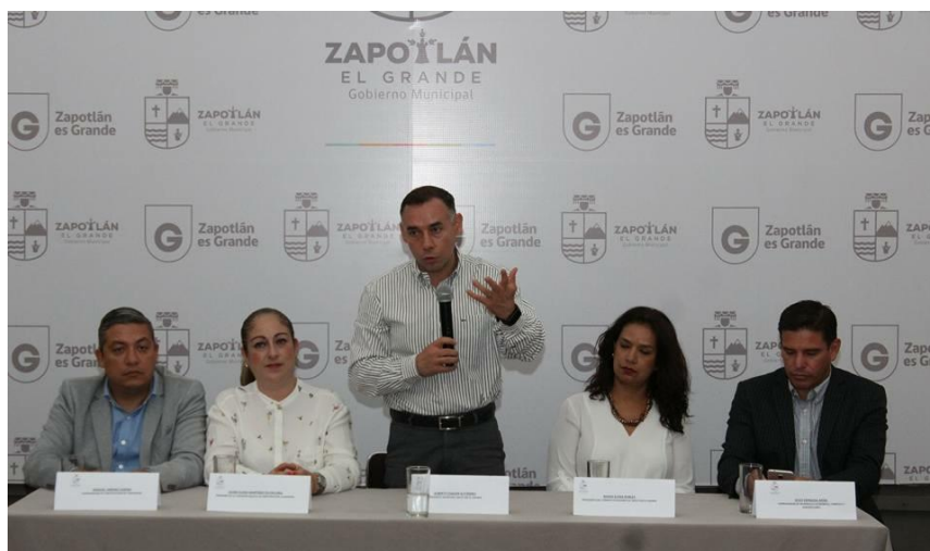
RUEDA DE PRENSA. PRESENTACION DE CONSULTA CIUDADANA 2033. 15 DE MAYO DE 2017