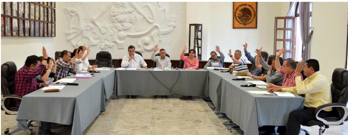
SESIÓN EXTRAORDINARIA NO. 35. 15 DE MAYO DE 2017