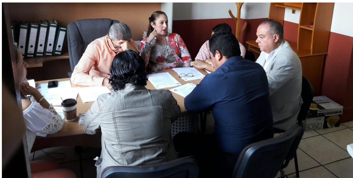
09 DE JUNIO DE 2017