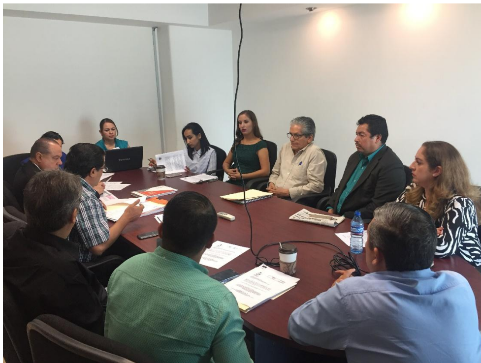
SESIÓN ORDINARIA 29 DE JUNIO DE 2017.