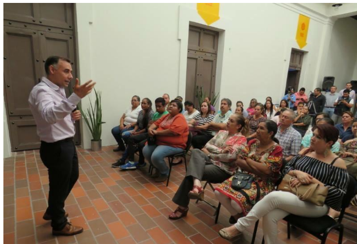
SEGUNDA ENTREGA DE PROGRAMA GRANDES EMPRENDEDORAS. 23 DE MAYO DE 2017