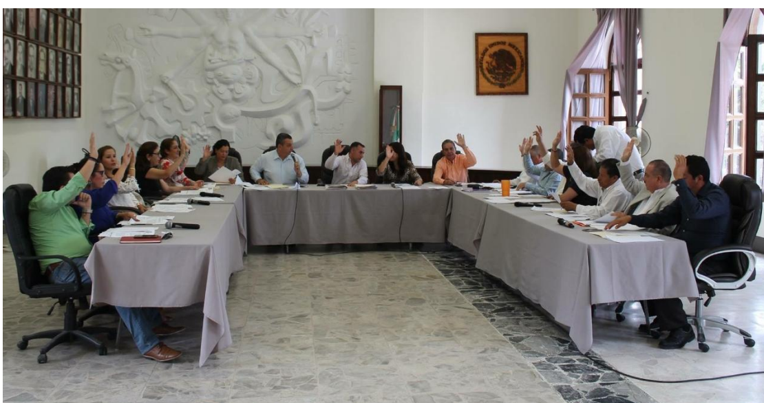
08 DE MAYO DE 2017. SESIÓN EXTRAORDINARIA NO. 34