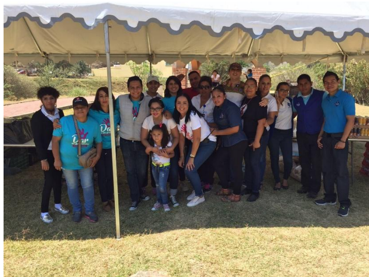
DIA DEL NIÑO. 30 DE ABRIL DEL 2017