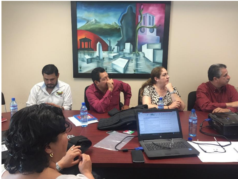
FALLO EN LA COMISION DE ADQUISICIONES. 30 DE MAYO DE 2017