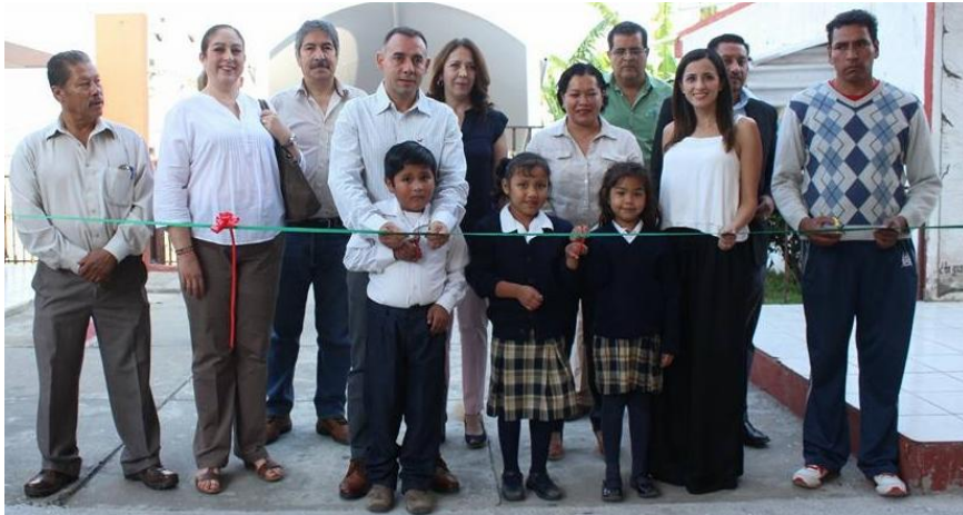
INAUGURACION DEL DOMO DE LA ESCUELA DEL BARRIO DE CRISTO REY. 29 DE MAYO DE 2017