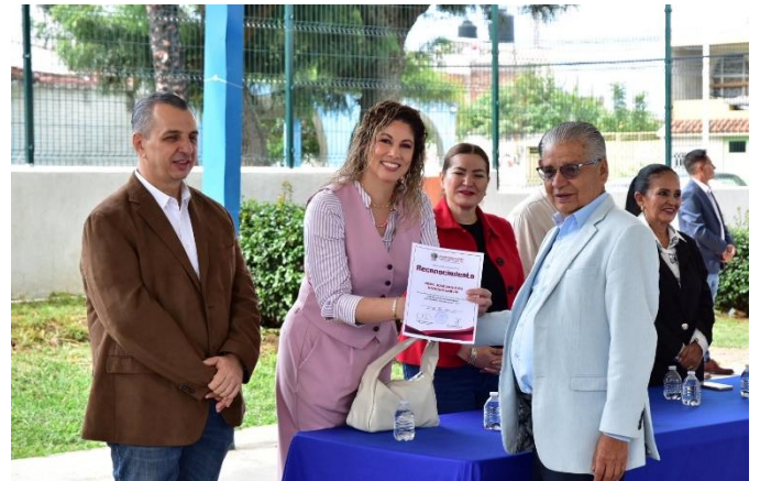
Apertura de la Jornada “Cruza con Moño Rosa” en Apoyo a la Lucha Contra el Cáncer de Mama Jardín Principal