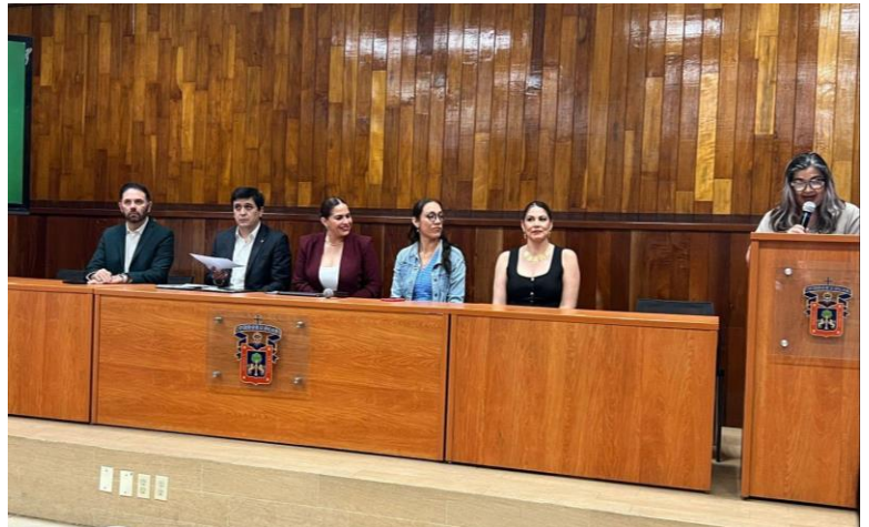
Entrega de Apoyo Personas Grandiosas "José Clemente Orozco" Patio Central de Presidencia